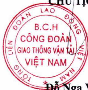
Đỗ Nga Việt